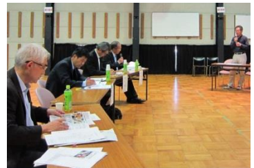
▲プレゼンテーションの様子