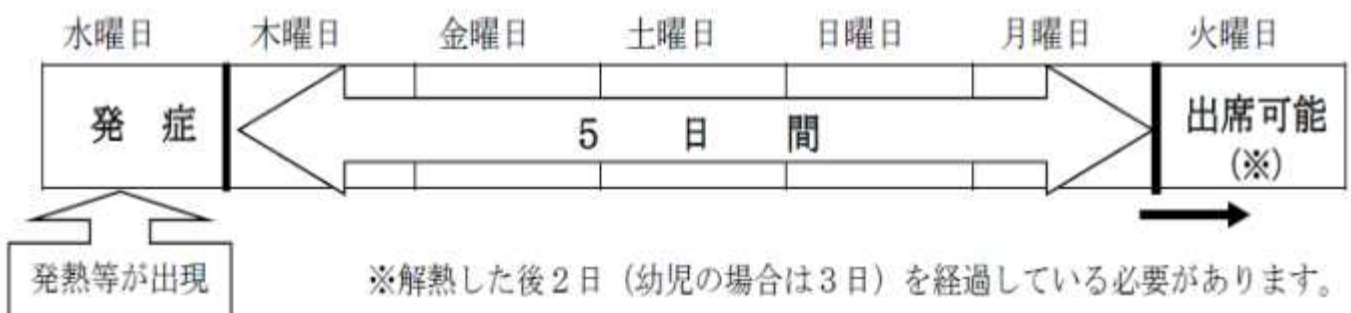
図2 インフルエンザに関する出席停止期間の考え方

なお、インフルエンザの出席停止期間の基準は、「発症した後5日を経過」し、かつ「解熱した後2日（幼児にあっては3日）を経過」するまでであるため、この両方の条件を満たす必要があります。