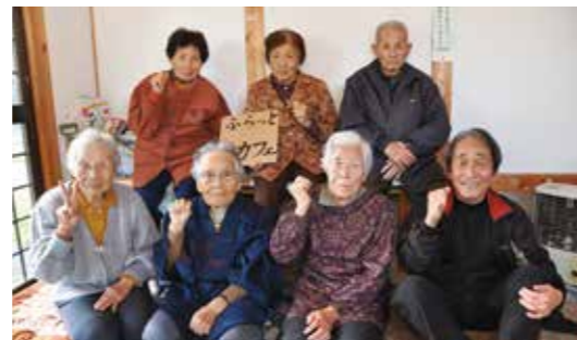
日上町内会下条地区のふらっとカフェ