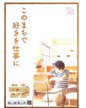
移住プロモーションポスター

市では、全国の皆さんに「津山で住むことの良さ」を伝えるため、平成27年度から開設した定住ポータルサイト「LIFE津山」や、補助金制度、住まい情報バンク、IJUサポーターのほか、移住・定住プロモーションや津山ぐらし移住体験ツアー、大都市圏での移住相談会、移住者交流会などの企画を実施しています。これらの取り組みが津山への移住のきっかけとなっています。