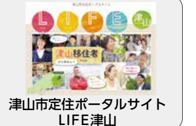
津山市定住ポータルサイト LIFE津山