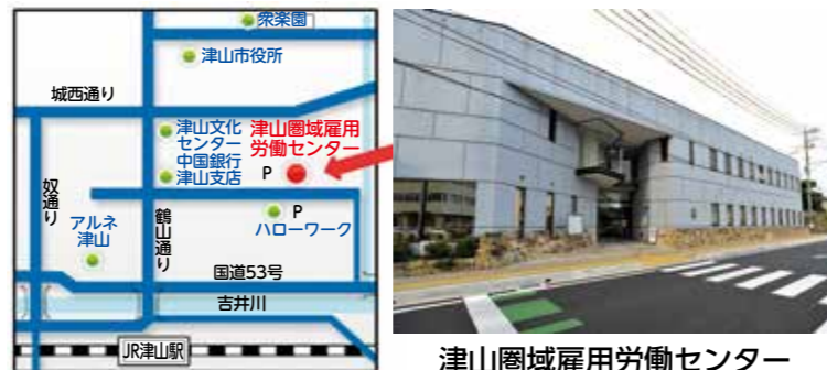
津山圏域雇用労働センター