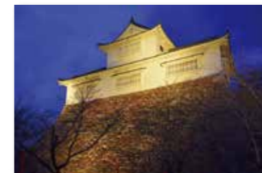
津山城跡ライトアップ事業

津山城をLED照明でライトアップしました。多彩な色に変化し、幻想的な雰囲気の津山城を楽しむことができます。