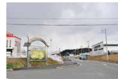
津山産業・流通センター

企業立地奨励金制度をはじめとした企業誘致への取り組みにより津山産業・流通センターでは新規立地の企業が増加しました。