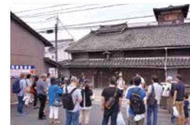
IJUトータルサポート事業

津山市への移住希望者に、情報の発信や移住体験ツアー、住居と仕事のマッチング(適合)などを行ったことにより津山市への移住者が増加しました。