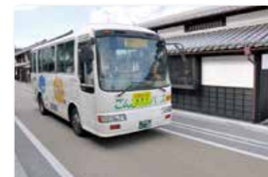
ごんごバス運行補助金

市が運行を委託している市内循環バス「ごんごバス」や「市営阿波バス」など公共交通の運行を補助しています。