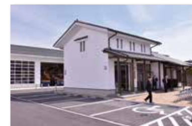
津山城下町歴史館整備事業

田町の武家屋敷の風情を残しながら、岡山県指定重要有形文化財の津山だんじりや、城下町津山の歴史と文化を伝える資料を展示しています。