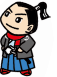
津山市環境キャラクター 津山太助