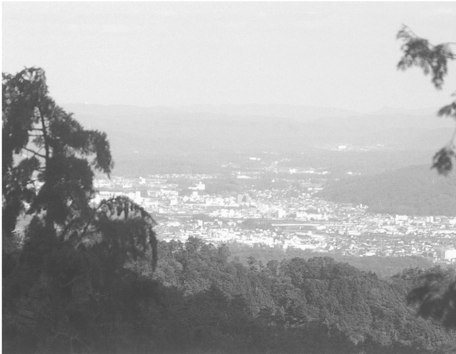
(岩屋城本丸から津山市中心部を望む)