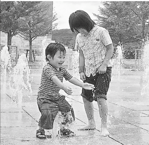
▲立ち上がる噴水に歓声を上げる子どもたち