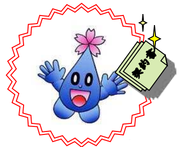
津山市水道局マスコットキャラクター ブロックちゃん