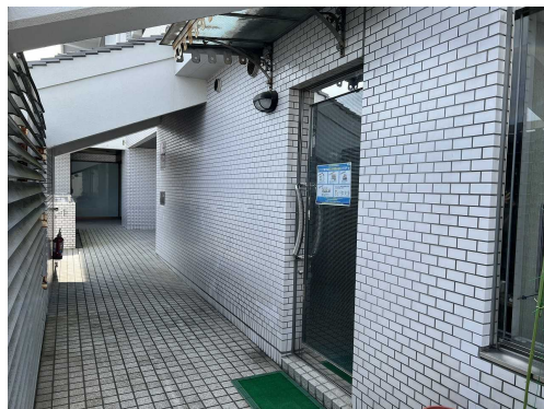
02 屋外通路からの喫茶部分入り口