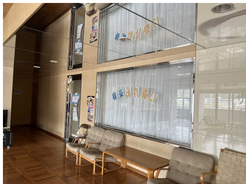
01 ふれあいサロンからの喫茶部分入口