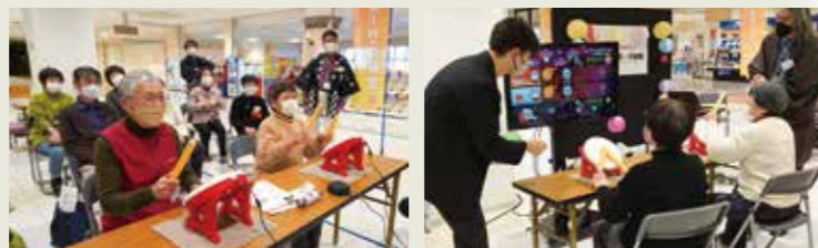
※昨年の体験会の様子(太鼓の達人) © Bandai Namco Entertainment Inc.