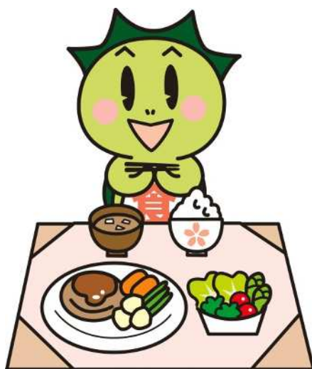
津山市食育推進キャラクター「しょくたん」