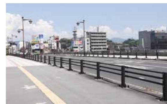
閻津山郷土博物館(山下) ☎ 22-4567