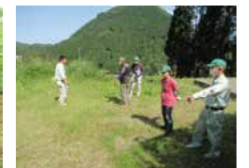
▲農地パトロールの様子 ▲現地確認の様子