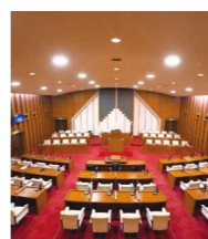
市民の代表を選ぶ過程だからこそ、費用対効果を考える姿勢が必要