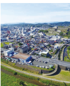
今後のまちじゅう博物館構想は