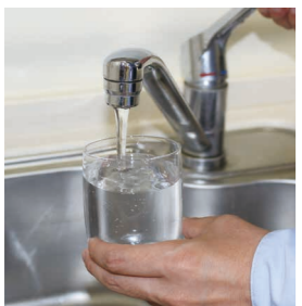
水道料金の減免は