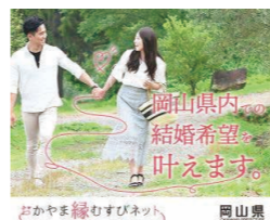
おかやま縁結びネットワーク (岡山県のHPより引用)

答 登録者数は、令和5年5月末現在男性1,032人女性878人。会員同士の成婚数は225組。