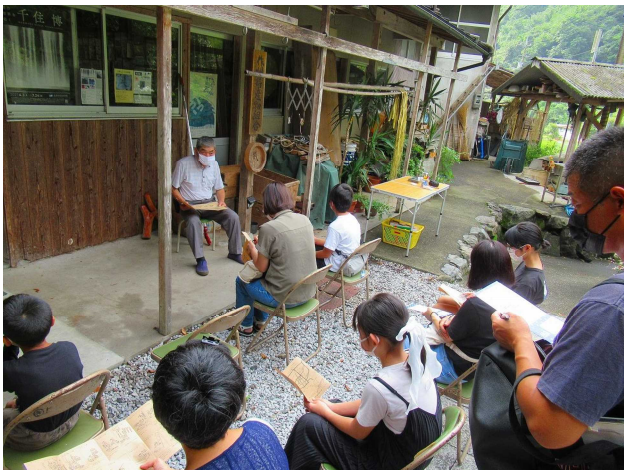
横野和紙ができる工程などをお聞きしました。