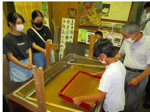
半紙の大きさの紙に挑戦。なかなか難しいです。