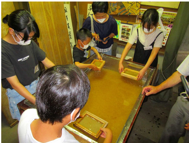
ハガキをみんなで漉きました。