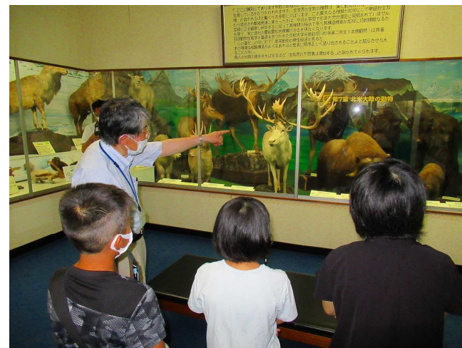
北米大陸の動物たち