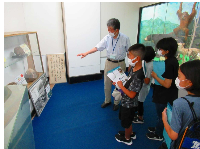
ニホンカワウソ（ふしぎ館ただひとつの絶滅した種）