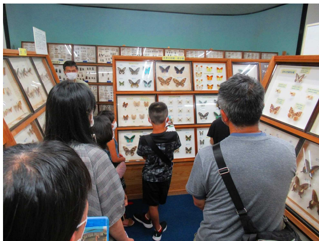
昆虫（チョウ）の世界（世界で最も美しいチョウと言われるのは、モルフォチョウ）