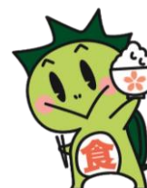
津山市食育推進キャラクター「しよくたん」