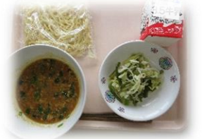
【献立例】 ジャージャー麺、牛乳、茎わかめのあえ物