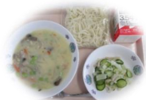
豆乳クリームスパゲティ