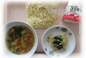
【献立例】 しょうゆラーメン、牛乳、中華あえ