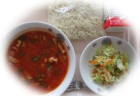
トマトソーススパゲティ