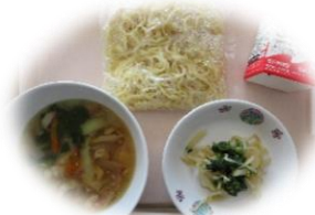
しょうゆラーメン